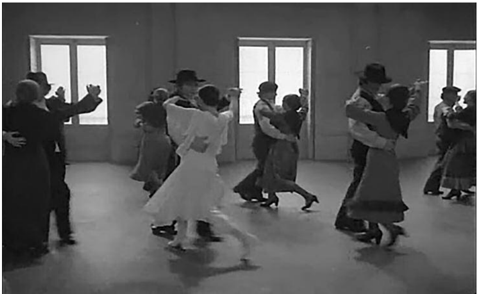
Carlos Saura, Bordas de sangre , 1981