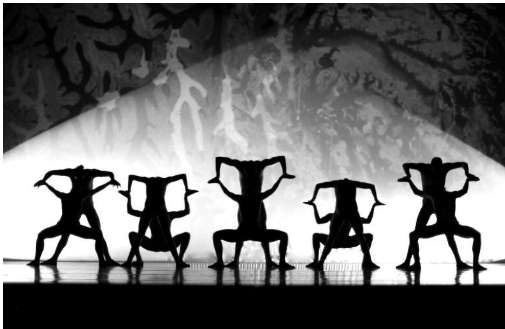
Alvin Nikolais, Liturgies (1983), « Shadow Tom », Ririe Woodbury Dance Company, Salt Lake City