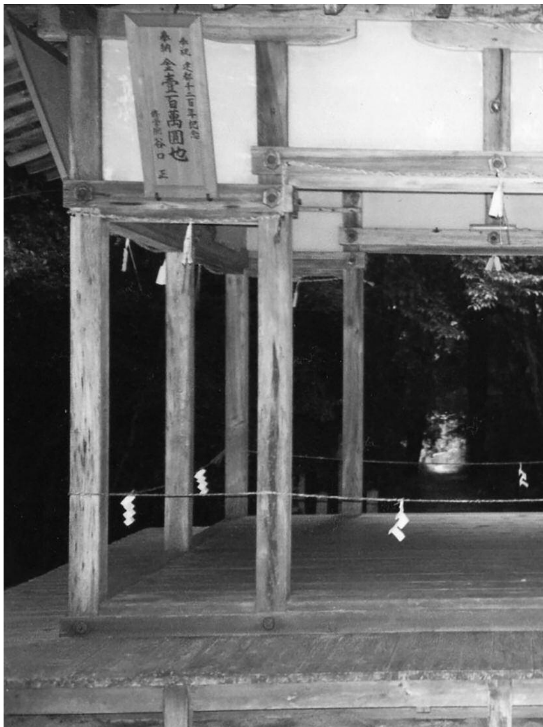
Kagura-den, pavillon dédié à la danse en tant qu'offrande