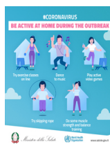
#CORONAVIRUS - Be active at home during the outbreak