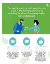
Using face masks in the community