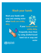
Wash your hands