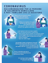
Coronavirus, raccomandazioni per le persone in isolamento domiciliare e per i familiari che le assistono