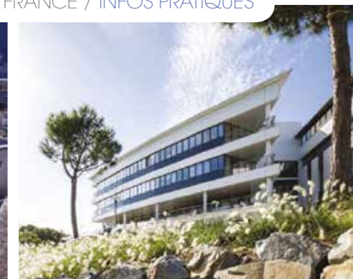
De gauche à droite : CHU d'Amiens – Centre Antoine Lacassagne, Centre de lutte contre le cancer de Nice – Institut de Cancérologie de l'Ouest, Nantes