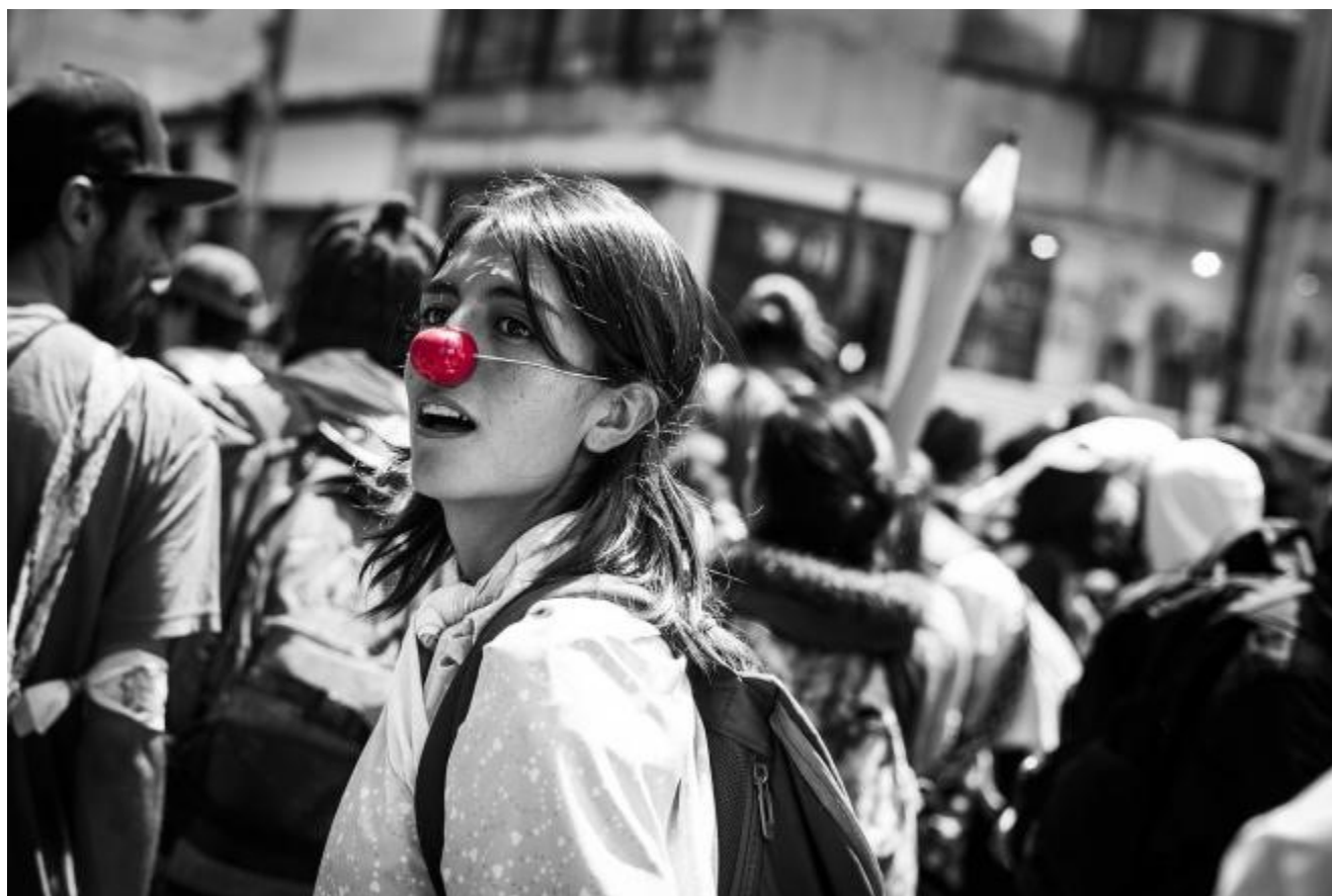
Comme un pied... de nez... à la désespérance.

Ce ne sera pas simple. Trouver une voie de changement est d'autant plus compliqué que nombreuses sont les voix discordantes qui entendent ou prétendent l'incarner — exclusivement parfois. Entre la gauche de gouvernement (qui assume de mettre les mains dans le cambouis) et les émules de Pierre Dac (« Pour tout ce qui est contre, contre tout ce qui est pour »), la synthèse sera difficile. Mais il s'agit de chercher à avancer sans se livrer à un duel sur le thème « plus révolutionnaire (ou plus réaliste) que moi tu meurs ». Ça implique de ne pas commencer par les anathèmes, les invectives et les excommunications (même matérialistes). Pour ne pas nous désespérer nous-mêmes quand on prétend offrir l'espoir.