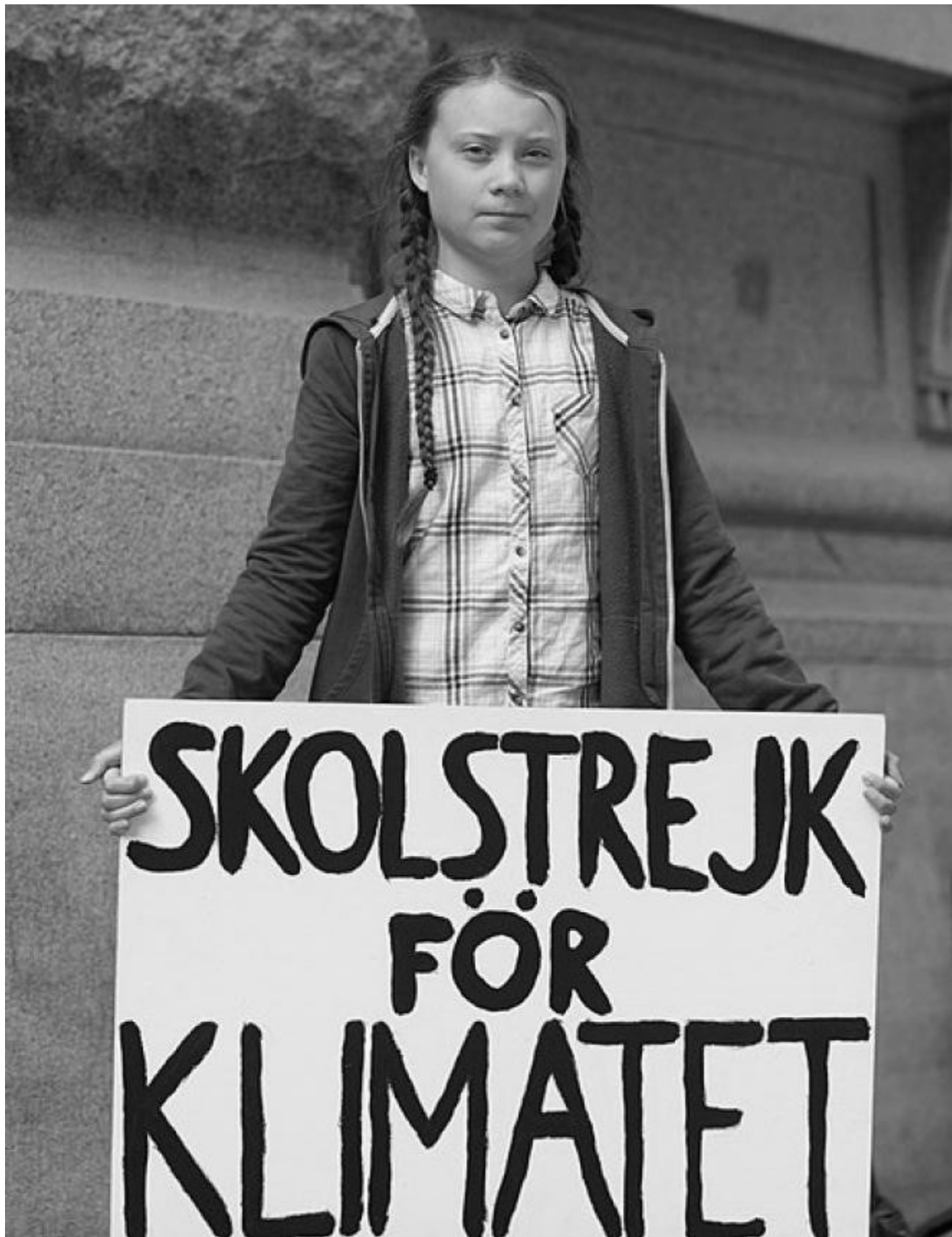
Greta Thunberg devant le Parlement suédois (2018)

Dans un monde verrouillé où dominent les discours convenus et les postures de circonstances, y compris chez les écologistes patentés, la protestation de la jeunesse européenne est apparue comme significative et, à