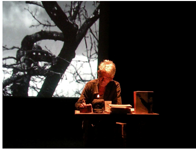
© Joëlle Cousinod : Bernard Meulien

« À Joëlle... Fleurs et racines se mélangent et s'entr'mêlent dans notre mémoire... et les fruits émergent mots... Amitiés VR »